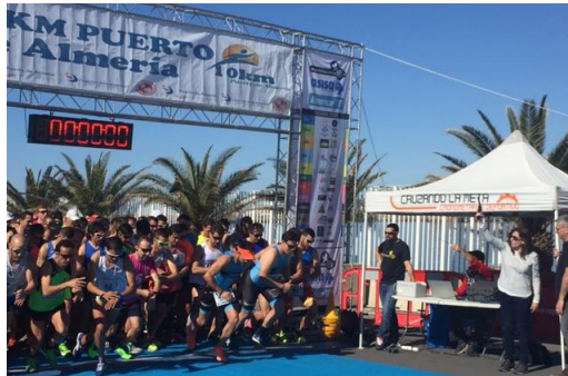
Carrera 10 Km del puerto- X Edición 10 de abril