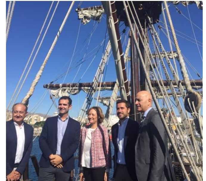
Visita a la Nao Victoria