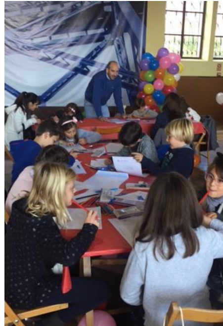
Concurso de Dibujo y Felicitación de Navidad